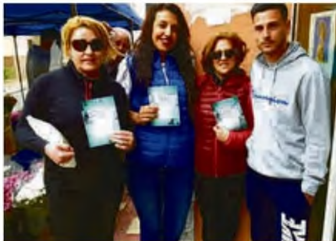
Actividad de fomento del comercio local dentro del proyecto AgroCultura para el desarrollo de las zonas rurales.