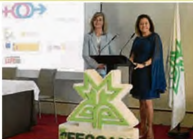
Jornadas sobre cooperativismo e igualdad organizadas por la Federación de Cooperativas el pasado año en Lorca.

Las cooperativas disponen de un plan de formación y capacitación adaptados a los procesos que desarrollan, dando formación y sensibilización a los distintos grupos de interés (socios, empleados, colaboradores,...). Facilitan la integración de