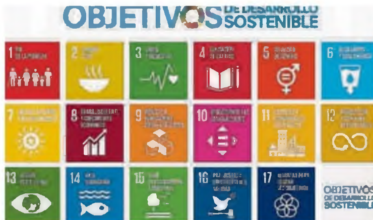
Objetivos de Desarrollo Sostenible. FECOAM

Fecoam y sus empresas asociadas impulsan proyectos y programas para fomentar aspectos como la igualdad social y laboral o unos hábitos de vida saludables