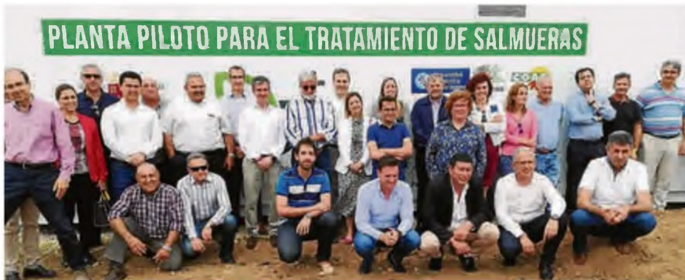
Visita de cooperativistas e investigadores a la Finca Tomás Ferro donde realiza sus investigaciones la Cátedra de Agricultura Sostenible.

Los técnicos que asesoran a las cooperativistas prescriben en sus tratamientos productos que cumplen con todas las normas de seguridad e higiene, y además, realizan controles periódicos