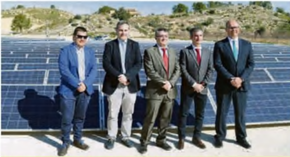
Inauguración de las obras de mejora de la Comunidad de Regantes de Pliego con la instalación de placas solares.

en el mercado laboral y en la toma de decisiones de las mismas. La representación de género es un factor importante de progreso en las cooperativas y, por esta razón, implementaron instrumentos para mejorar la representación de las mujeres en sus órganos de gobierno y gestión.