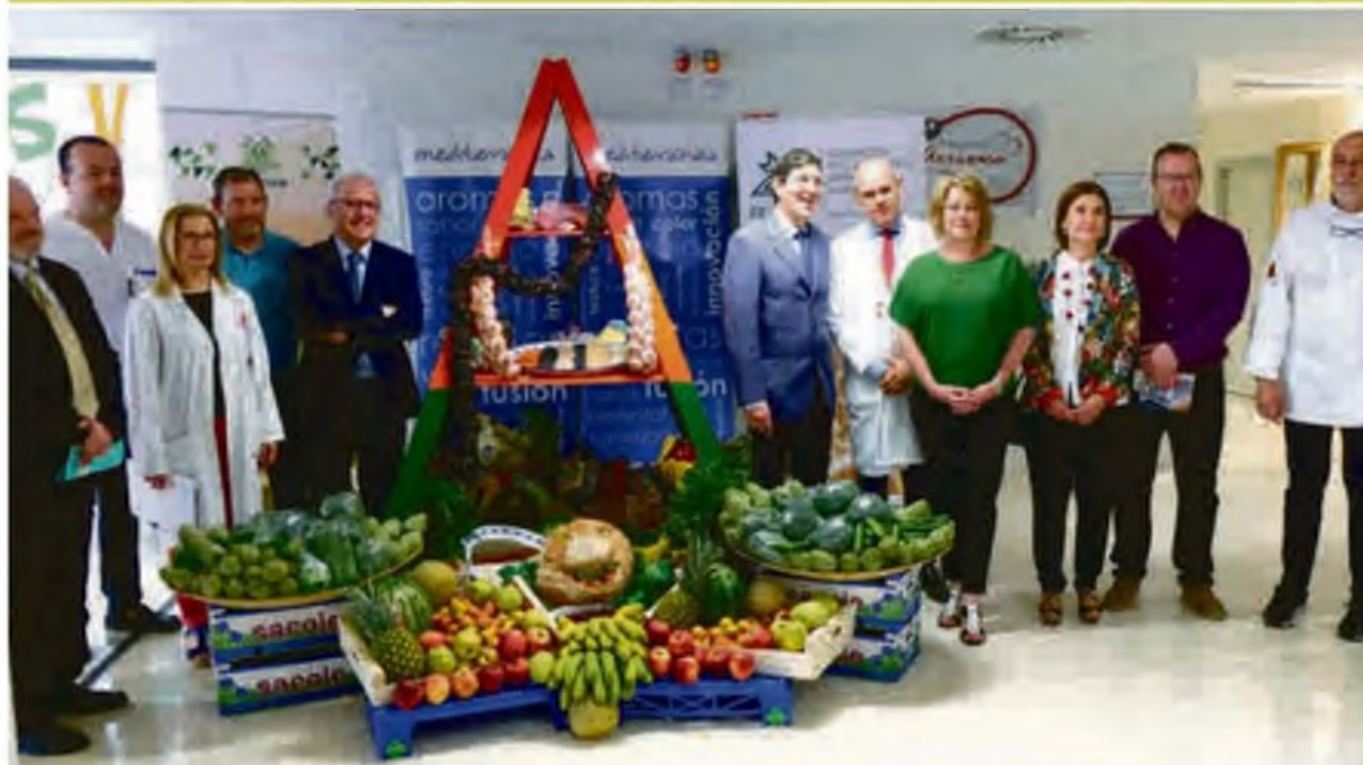
Representantes de Fecoam durante la inauguración de la Semana Saludable del Hospital Virgen de Arrixaca.

que garantizan el buen estado del producto, el medio ambiente y la salud de los trabajadores.