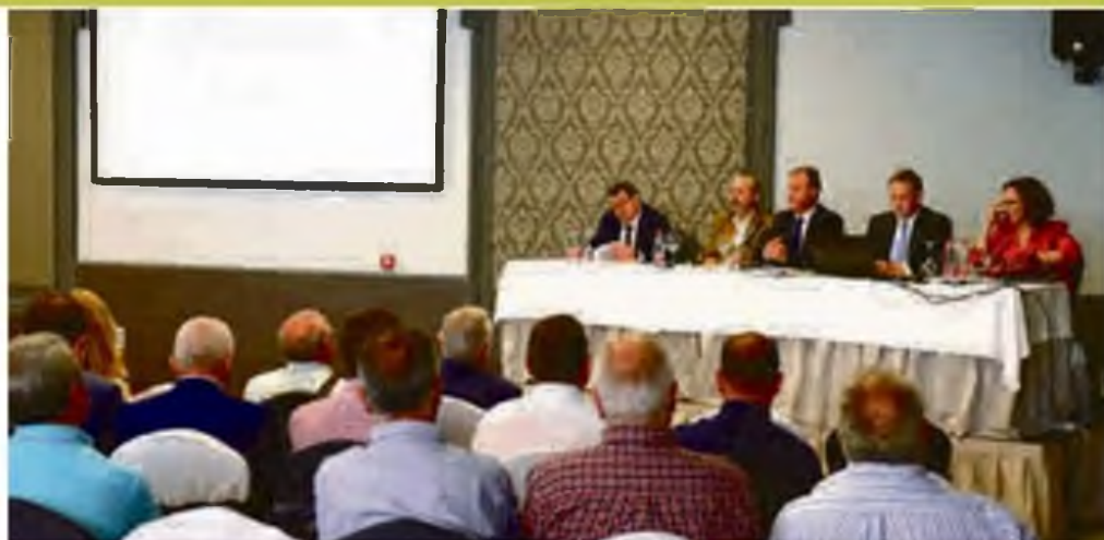
Asamblea de las cooperativas de segundo grado Sermuco de compra conjunta de insumos y materiales.

Proyectos de innovación ligados al cambio climático están siendo desarrollados por las cooperativas (Proyectos de mejora en la alimentación animal para evitar gases de efecto invernadero, proyectos de adaptación de variedades de frutales al cambio climático, proyectos de energía limpias,...). Además, debemos destacar que la propia actividad agrícola es fuente de sumidero de CO 2 . Las cooperativas reconocen la importancia de ser cada vez más eficientes y aprovechar todas las oportunidades disponibles para reducir las emisiones e implementar acciones de adaptación al cambio climático.