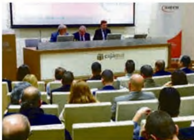
Jornada sobre innovación en la Industria agroalimentaria organizada por la Federación de Cooperativas el pasado año.