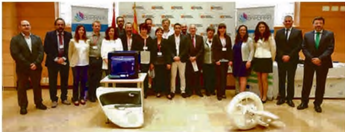
Presentación del proyecto europeo BARBARA para la reutilización de desechos y fabricación de nuevos materiales reciclados.

Minimizar el consumo de recursos en la producción de alimentos es una parte integral del trabajo diario de todas las cooperativas, especialmente cuando se trata del consumo de recursos naturales, la minimización de residuos y la apuesta por el uso de tecnologías más limpias. Los esfuerzos de las cooperativas se basan en un objetivo común: construir comunidades sostenibles.