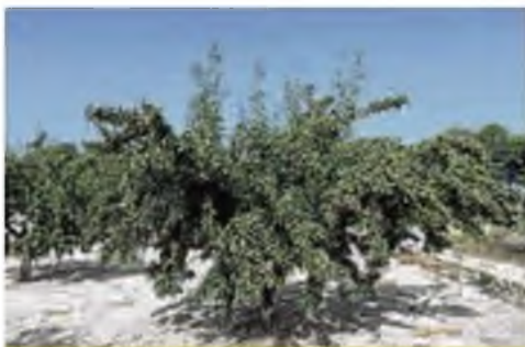
A la izquierda, una plantación de almendros murcianos. A la derecha, almendras murcianas en las instalaciones de la cooperativa Vega de Pilego.

El objetivo principal de este proyecto es «la diferenciación de la almendra murciana, obtenida en un escenario de cambio climático, en el mercado mediante la difusión de sus especiales características genéticas, morfológicas, organolépticas y nutricionales», explican los responsables del proyecto.