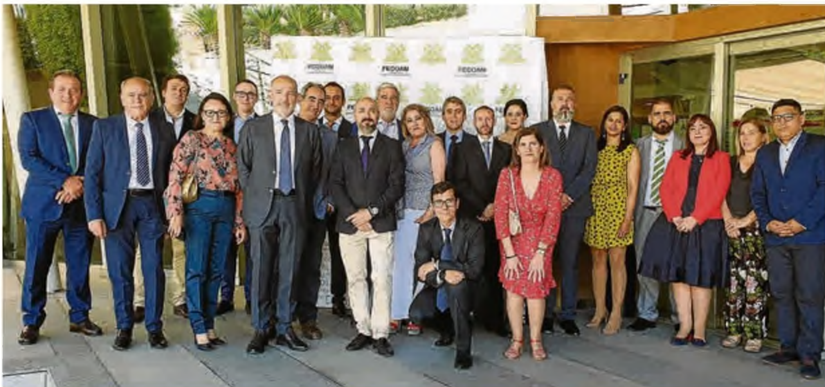
Equipo de la Federación de Cooperativas Agrarias de la Región de Murcia durante la pasada Asamblea General, en Lorca.