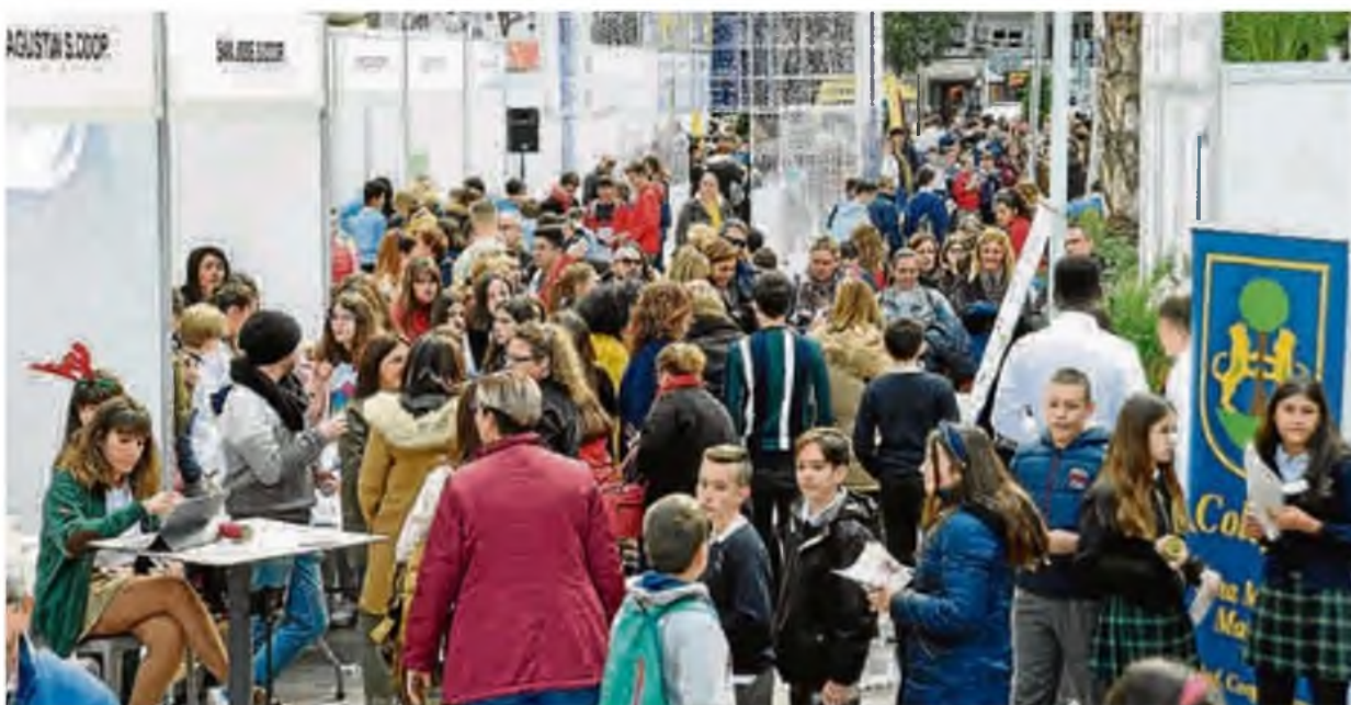
La feria superó los 1.300 alumnos con 57 cooperativas escolares.

Un evento que se celebra en el marco del Pacto por la Excelencia de la Economía Social, 2018-2020 y que en su cuarta edición acogió un 20% más de cooperativas escolares que el pasado año. >P. 2 y 3