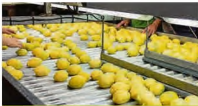
Cooperativa agraria especializada en cítricos de la Región. C. HEREDIA

La Responsabilidad Social Empresarial (RSE) es un elemento que se ha incorporado a las empresas dado su carácter activo en el mundo actual. Aplicada a las cooperativas, comprende todas aquellas acciones que pretenden mejorar las relaciones con todos los grupos de interés, ya sean los propios cooperativistas, proveedores, clientes o trabajadores.